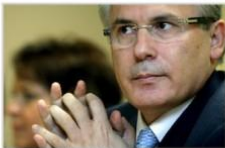
El juez de la Audiencia Nacional, Baltasar Garzón.

El juez Baltasar Garzón, que durante tres años ha instruido en secreto el sumario del 'chivatazo' a ETA, ha desglosado de la causa una parte de la investigación que no guarda relación directa con la trama de extorsión de El Faisán, pero que tiene una enorme relevancia política, según han señalado a este diario fuentes jurídicas. Dicha documentación habría sido convertida en una pieza separada secreta de la del 'chivatazo' que, a su vez, es una pieza separada, y hasta el pasado octubre también secreta, del sumario sobre el aparato de extorsión de la banda terrorista. Un auténtico encaje de bolillos jurídico.